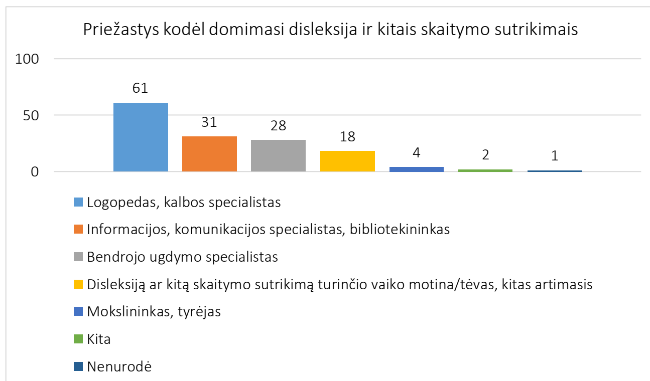
1 pav. Respondentų nurodytų priežasčių, dėl ko domimasi disleksija ar kitais skaitymo sutrikimais, skaičius.

Apklausoje dalyvavo 133 asmenys. Į pirmą klausimą („Disleksija ir kitais skaitymo sutrikimais domėtės kaip:“) su keliais galimais atsakymų variantais atsakė 132 asmenys (1 pav.), 15 iš jų nurodė daugiau nei vieną atsakymo variantą ir / arba patikslino. Daugiau nei kas antras asmuo, dalyvavęs apklausoje, disleksija ir kitais skaitymo sutrikimais domisi kaip logopedas, kalbos specialistas (61 respondentas; 46 proc.), 31 respondentas (23 proc.) domisi kaip informacijos, komunikacijos specialistas, bibliotekininkas, o 28 respondentai (21 proc.) nurodė, kad šia tema domisi kaip bendrojo